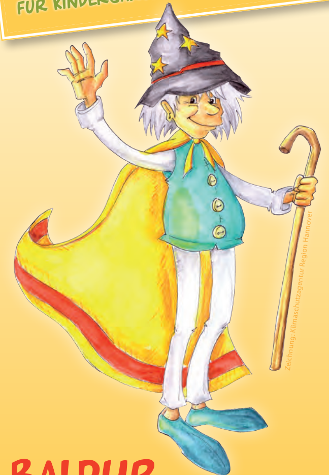
Zeichnung: Klimaschutzagentur Region Hannover

EIN AKTIONSPROGRAMM FÜR KINDERGÄRTEN & GRUNDSCHULEN